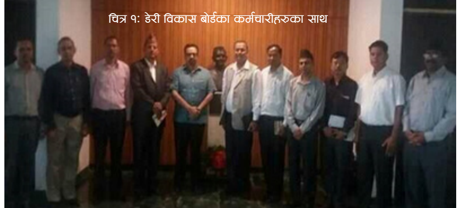
चित्र १: डेरी विकास बोर्डका कर्मचारीहरुका साथ

सहकारीको माध्यमबाट संचालित दुग्ध क्षेत्र विश्वकै एक प्रथम स्थानमा रहेका छिमेकी मुलुक भारतले