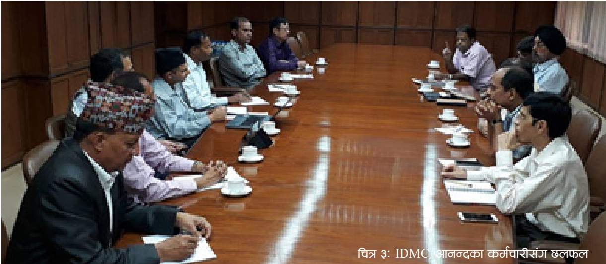
चित्र ३: IDMC आनन्दका कर्मचारीसंग छलफल